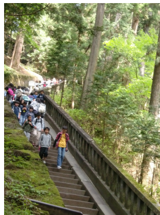
いえやすこう ねむるおくしや 家康公が眠る奥社 へと続く207段ある 石段