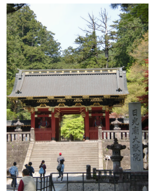
いえみつこう ねむる 家光公が眠る 大猷院