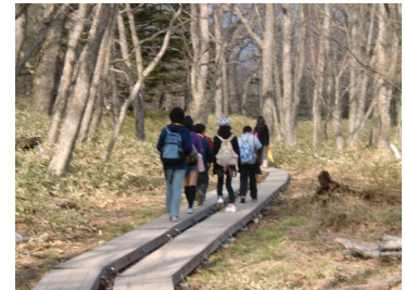
せんじようがはら つづくもくどう 戦場ヶ原へと続く木道