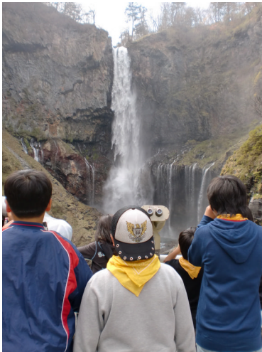
けごん たき 華巖の滝