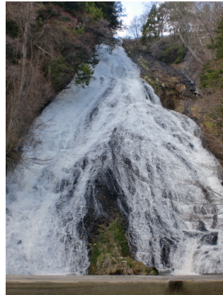
ゆ たき 湯 滝