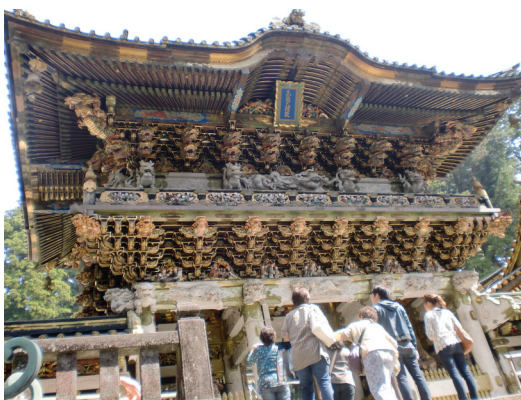
にっこうとうしょうぐう ようめいもん 日光東照宮 陽明門