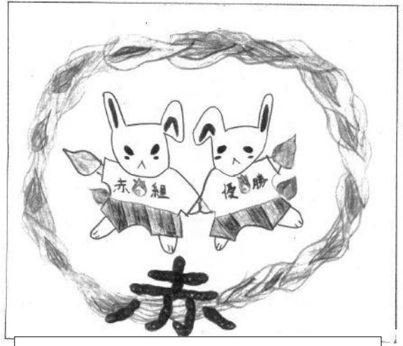
ファイヤーラビット

スポーツの秋。皆様には、ますますご健勝のこととお喜び申し上げます。鮮やかな芝生の上で、今年も運動会を開催できることをうれしく思います。保護者、地域ボランティアの皆様のお力添えに感謝申し上げます。