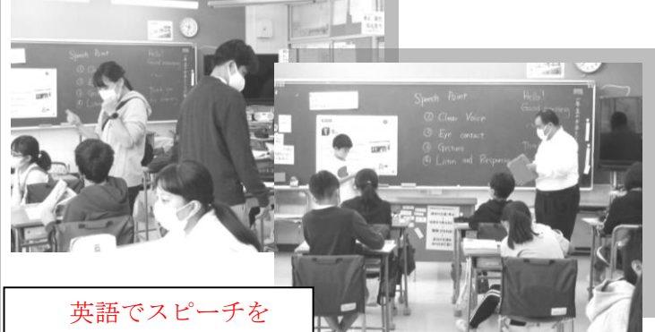
英語でスピーチをしているところです。