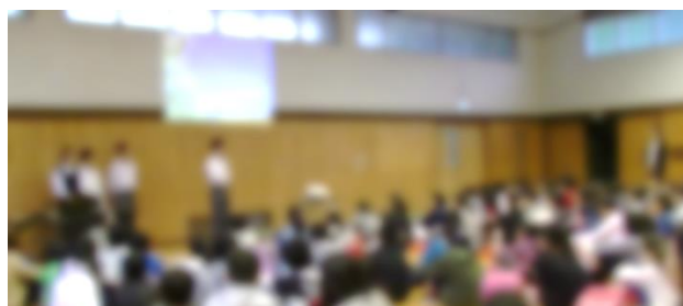
中学校生活についてのガイダンス