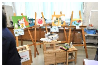
芸術部の作品 他にもたくさん