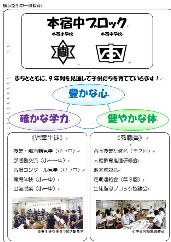
小中一貫教育推進の概要 ホームページでご覧いただけます