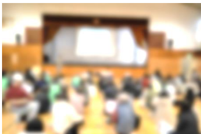
避難所生活について