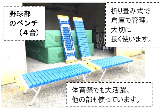
野球部のベンチ (4台)