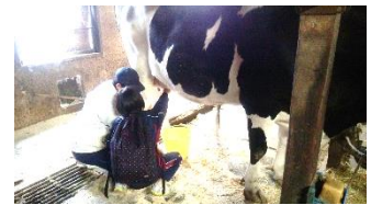
ドキドキの乳しぼり体験

1日目には、乳牛の乳しぼり体験。大きな牛に圧倒されながらも、勇気を出して挑戦しました。