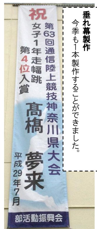
垂れ幕製作 今季も1本製作することができました。