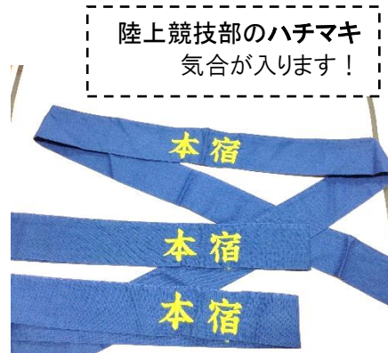
陸上競技部のハチマキ 気合が入ります！