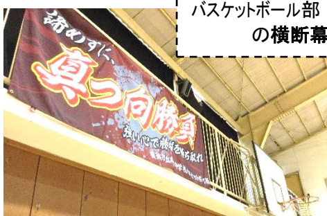
バスケットボール部の横断幕

その一端をご紹介しますとともに、保護者の皆様、地域の皆様、自治会関係者の皆様に感謝申し上げます。今年度購入した物品等は、まとめて年度末に「部活動振興会だより」に掲載いたします。