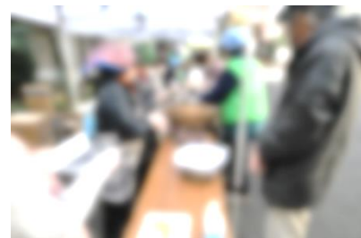
抜群のチームワークの炊き出し