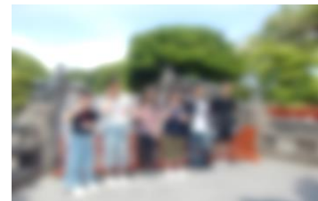
鶴岡八幡宮で記念写真