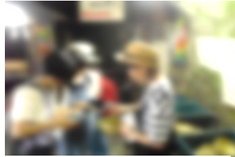
大人気の宇賀福神社(銭洗弁財天)