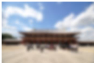
古の都を見学 (奈良・薬師寺)

「修学旅行」。3年間の中学校生活の中でもひととき心に響くことば。それは生徒にとっては大きな期待と楽しみであり、同時に学びの集大成となるものです。学校生活で培った力はもちろん、これまでの経験を生かしてよりよい修学旅行にしよう、という生徒たちの思いが伝わってきた行事でした。旅行中はいろいろな場面で生徒たちのたくさんの笑顔を見ることができました。笑顔で過ごすことができたのは、生徒たち自身の今までの取組や成長があったからこそだと思います。