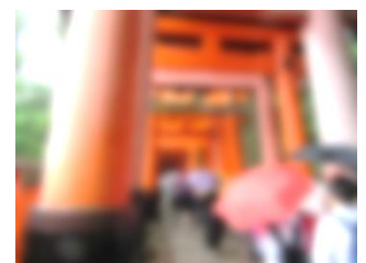
圧巻の千本鳥居 (京都・伏見稻荷大社)