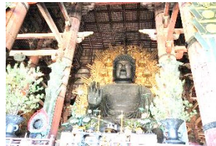
翌朝、大仏様にお参り (奈良・東大寺)