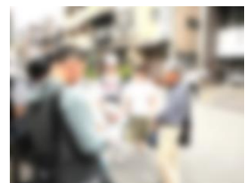
京都班別行動 現地ガイドさんと