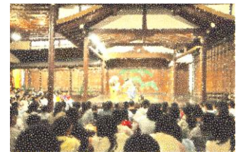
能・狂言鑑賞 (京都・大江能楽堂)