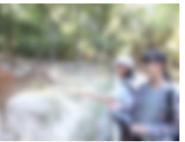
鹿とたわむれ… (奈良・奈良公園)