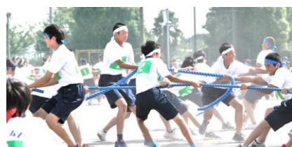
2年学年種目「綱取り」