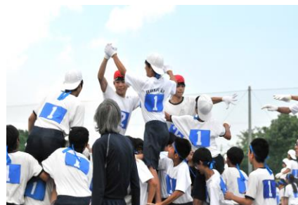
3年学年種目「騎馬戦」

体育祭は終わりましたが、クラスの結束は芸術祭・合唱コンクールでも発揮されるはずです。次の「祭」に向けて、頑張っていきましょう。