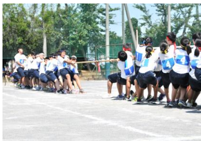
「地区別対抗綱引き」 《左近山・桐が作・小高・三反田》 連合チームが優勝！

応援に駆けつけてくださったご来賓の皆さま、地域の方々、保護者、PTAの皆さまには心から感謝いたします。ありがとうございました。来年度以降の体育祭がさらに充実した行事になるよう取り組んで参ります。これからもご支援いただけると幸いです。