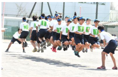
今年度からの新種目 全校クラス対抗「大縄跳び」