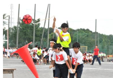
1年学年種目「カウボーイ」