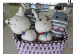
<美術科：夏休みの作品→>