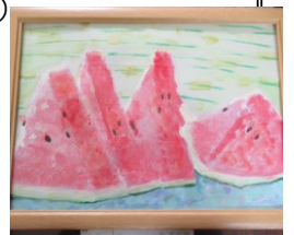
<美術科：夏休みの作品↑>