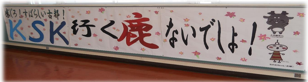
実行委員会が制作したスローガンの横断幕

そして3年生になった今、学習してきたことを生かして班行動のコースを考えたり、クラスで行く場所を決めたりという準備の仕上げに取りかかっています。これまでに培ってきた京都・奈良についての知識や仲間との絆を生かして、楽しく最高の思い出となる修学旅行にしていきたいです。