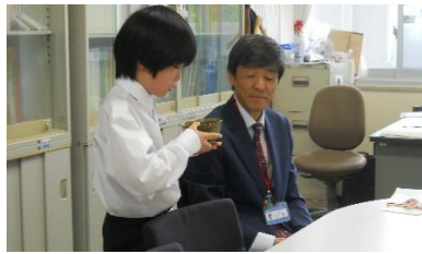
校長先生も・・・