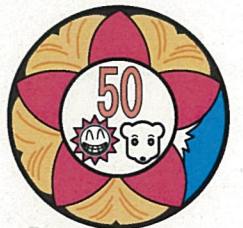
50周年シンボルマーク