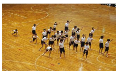
全身を使って「表現」しました。

当日は、堂々と演技切り、さらに他区の素晴らしい演技を楽しみながら観覧していました。