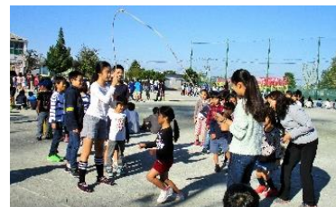
1年生の長縄を回す6年生。 (10月の長縄集会より)