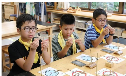
竹でできたトンボのバランス、絶妙！