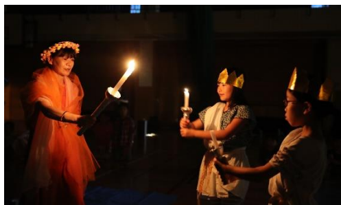
リーダーシップ・協力・けじめ・チャレンジを大切に

火の神から火を受け取り、高尾の夜に灯りをともしました。4年生の絆がぐっと深まった時間になりました。