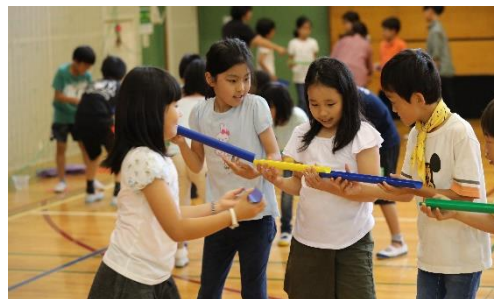
…よし、やってみよう！今度こそは！

どうしたらクリアできるのか、みんなで話し合いながら様々な課題を乗り越えることができました。