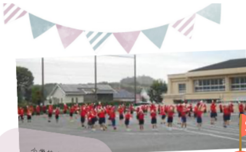
小学校生活 初めての運動会