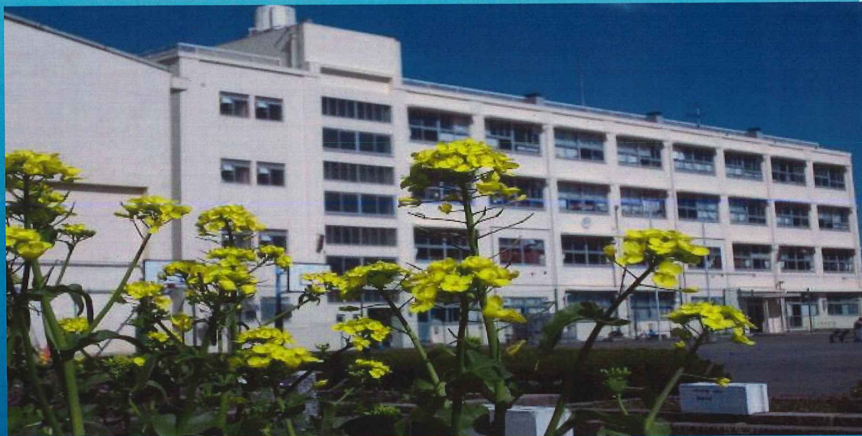
横浜市立荏田小学校