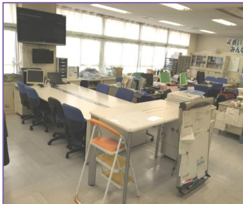
忙しいなかでも コミュニケーションを生み出す場所