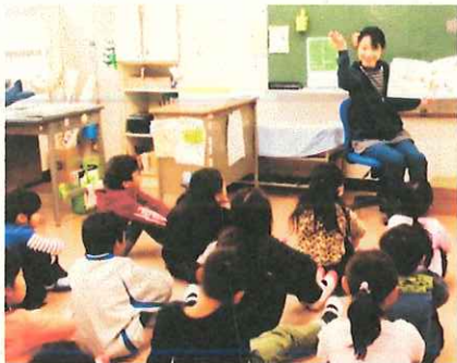
職員による読み聞かせ

二小の11月は読書月間、PTAからは皆で集めたベルマークを本に交換してプレゼントしていただきました。いつものスマイル先生に加えて職員も読み聞かせを行いました。昨年に続いてペア学年の上級生が下級生に本を紹介する取組では、うれしそうに本をのぞき込む下級生の笑顔とそれを見た上級生の笑顔が重なって、見ているこちらまで温かい気持ちになりました。図書室前には「読書の木」が登場し、毎日たくさん子どもたちでにぎわっています。「すごいなあ。」「そういえば、こんなことがあったな。」「自分だったらどうするだろう。」「へえ、そうだったんだ。」そんな思いを表現した読書感想文コンクールの表彰も行いました。子どもたちは、この読書月間でどんな本を読んだのでしょうか。大人になっても懐かしく思い出せる本に出