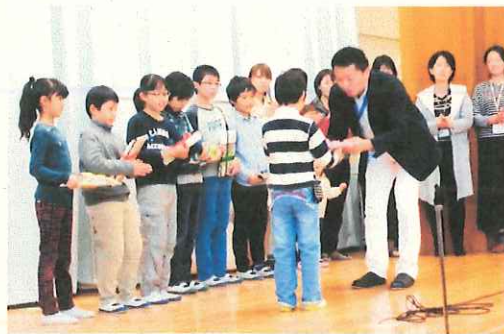
ベルマーク図書贈呈式

合ったでしょうか。たくさんの本と出会い、新しいことを学び、物語の世界に心躍らせ、すてきな言葉や表現を知り…、いろいろな楽しみ方をして、心豊かに成長してほしいと願っています。