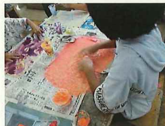
研究テーマをもとに、授業を参観します。

9月16日（金）に講師を招いて校内授業研究会がありました。授業後の研究討議では、「子どもをやる気にさせる授業」「子どもが本気で考える授業」「子ども同士関わり合って学習を深める授業」などについて職員で話し合いました。今後の指導に生かしていきます。