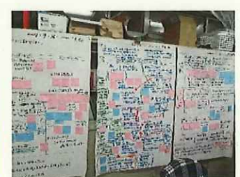
模造紙で成果と課題をまとめ、次の授業研究につなげます。