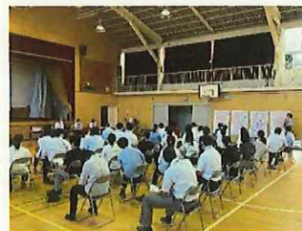
全体会で報告し合い、講師の先生の話の聞きます。