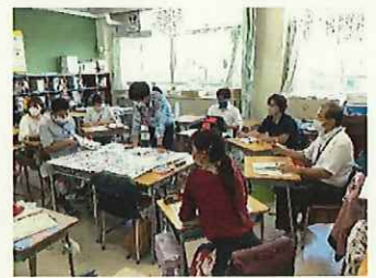
部会ごとに授業について協議します。