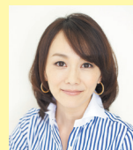
フリーアナウンサー 木佐 彩子