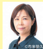
小説家 椰月 美智子