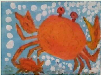
R4 戸塚区長賞 秋葉小学校2年