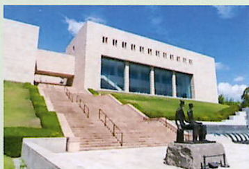
MOA 美術館 (熱海)