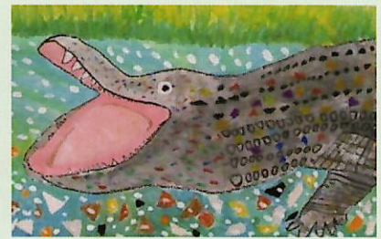
R4 横浜市教育長賞 秋葉小学校3年