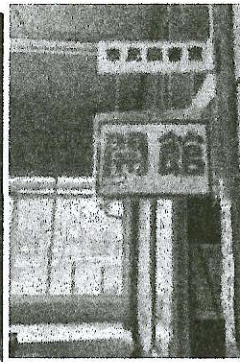
入ってすぐに新刊コーナー