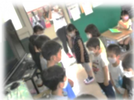
ようこそ 1年生タイム

6月23日に『ようこそ1年生タイム』を行いました。6年生が代表して、2年生から5年生までのお祝いのメッセージを1年生に届けました。1年生の嬉しそうな顔を見て、これからの1年生との関わりについて、「いろいろな工夫をして交流していきたい」と思いを表していました。「牛乳パックの開け方や傘のたたみ方、傘立てへの入れ方は動画を作って見てもらう」、「ホワイトボードなどを教室や廊下に置いて、困ったことや分からないことを書いてもらい、それらについて教えていく」など、様々なアイデアを出し合って意欲を高めています。今後、1年生にとって必要なことは何か、内容や方法について話し合いを深めて実行していきます。