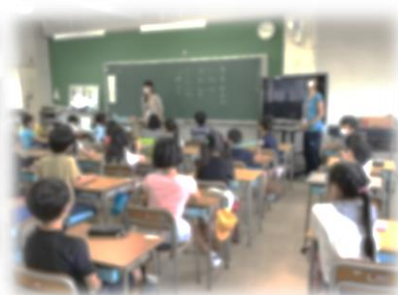
各教室で教師の自己紹介