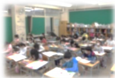
図画工作科の 学習

図画工作科の学習で、絵の具を使って絵を描きました。筆の使い方や水の量に気を付けて、季節感あふれる作品に仕上げました。点を打って桜の花びらを表したり、線を下から上に引いて草を表したりするなど、様々な工夫をすることができました。久しぶりにみんな揃って学習することで、かかわりが生まれ楽しそうに取り組んでいました。