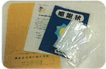
感謝状と 感謝の品（マスク）を発送