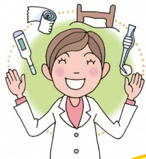
がっこうい せんせい 学校医の先生

入学・進級、おめでとうございます。新しい学年、新しい友だち、たくさんの「新しい」に出会うみなさんはわくわくドキドキ、心が忙しい毎日ではないでしょうか。早く慣れようと焦ってしまうこともあると思いますが、自分のペースで大丈夫。保健室からもみなさんのことを応援しています。保健室はみなさんが健康に過ごせるようにお手伝いしますので、どうぞよろしくお願ひします。