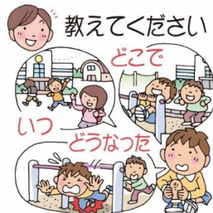
けんこうしん断のときにお世話になる先生方です。