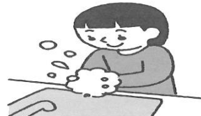
石けんで手洗い (定期的にこまめに)