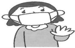
人と一緒のときはマスク ひまつを飛ばさない