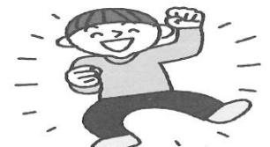
栄養や睡眠をしっかり 体力をつける