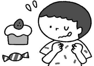
甘いものの食べ過ぎに注意