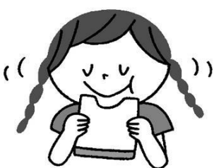
ゆっくりよくかんで食べる