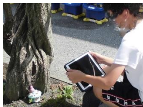
4年生 図工 自分の作品を好きな場 所において撮影

れいわ ねんど こうない かんきょう せいび れいわ ねんど ひとり だい たんまつ はいふ 令和2年度に、校内のWi-Fi環境が整備され、令和3年度に、一人に1台、端末が配付 (たいよ) されてげんざい いた こ 子どもたちはさまざま きょうが たんまつ きのう かつよう (貸与)されて現在に至っています。子どもたちは様々な教科で、端末の機能を活用しながら がくしゅう すす 学習を進めています。