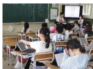
2年生 国語 教材文を共有し、自分の考えを書き込み、大型テレビ に映し出しながら発表をします。