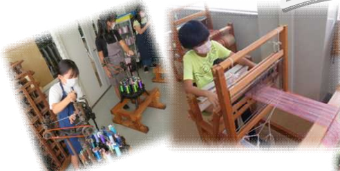
レインボープラザでは、自分の 選んだ伝統工芸を体験しました。