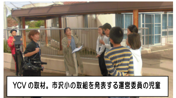
YCVの取材。市沢小の取組を発表する運営委員の児童