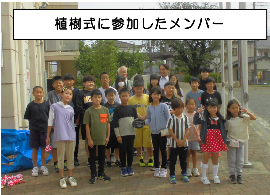
植樹式に参加したメンバー