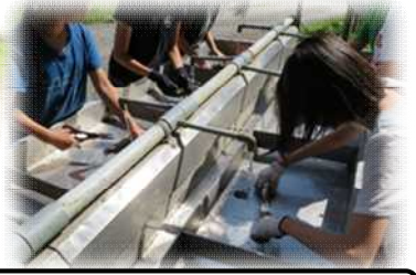
生きた魚をさばき、命の尊さを感じていました。