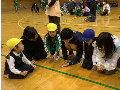
5年生:来年度へ向けて園児と交流しました。