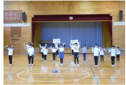
個別支援級:学習発表会の演技を発表しました。