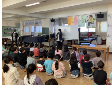
2年生:ソプラノコーダーに挑戦しました。