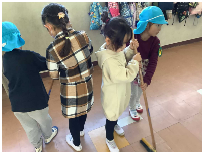
1年生:年長さんに小学校の生活を教えました。