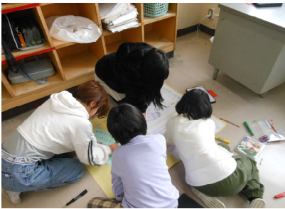
4年生:協力して、国語の発表資料を作っています。