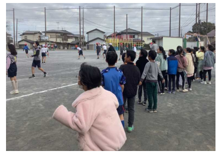
3年生:4年生に向けて、クラブ見学をしました。