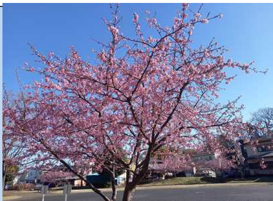
梶谷公園の桜 一足先に春の到来を伝えてくれています

梶谷公園の桜、神田公園の入り口にある梅の花、学校の菜の花が春の訪れを告げているように感じます。子どもたちも休み時間には元気に校庭に出て体を動かす子が増えてきました。