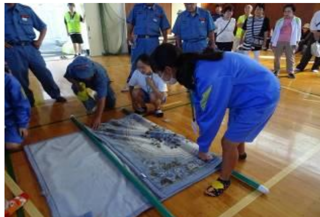
昨年度の防災拠点訓練の様子