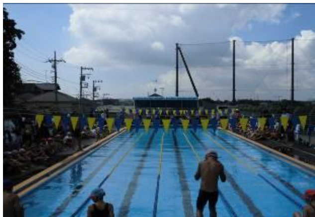
3小学校が集まった区水泳大会

菅中ブロックでは、こうした小学校同士の交流のほか、中学校と小学校の児童生徒の交流も行っています。来る9月1日(土)に行う地域防災拠点訓練では、菅田中の2年生が3つの小学校に分散し、それぞれの訓練の準備や運営のお手伝いをします。小学校からも6年生が参加し、地域の防災活動を見学したり体験したりします。地域の方々の取組に触れ、小中学生が共に地域の一員であることを実感してほしいと思います。