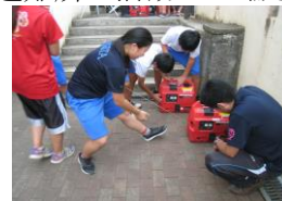
発電機を操作する中学生

9月1日(土)、地域防災拠点訓練が行われました。大規模地震発生等のときに菅田中ブロック各小学校が防災拠点としての避難所となる想定訓練です。中学2年生が卒業した小学校に赴き参加しました。中学生は訓練を通して、自治会の皆さんと共に地域の一員として避難所の活動の一端を担うことを自覚し、小学6年生は中学生が行う活動の見学を通して、避難所運営の概要を学びます。訓練後の閉会式で中学生が「2年前、先輩たちの活動する姿を見て学びました。今度は自分たちが地域の皆さんと共に活動し、小学生にその姿を見てもらえて嬉しかったです。」と語る姿が見られました。小学校から中学校、そして地域へと、学びの連続性を感じることができました。