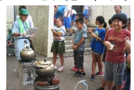
ロケットストーブの説明を受ける小学生