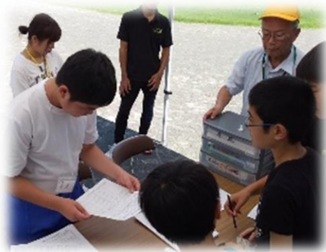
被災者役の小学生と 受付係役の中学生

8月31日(土)、地域防災拠点訓練が行われました。大規模地震発生等のときに菅田中ブロック各小学校が防災拠点としての避難所となる想定での訓練です。中学2年生が卒業した小学校に赴き参加しました。中学生は訓練を通して、自治会の皆さんと共に地域の一員として避難所の活動の一端を担うことを自覚し、小学6年生は中学生が行う活動の見学を通して、避難所運営の概要を学びます。自助(災害時に自分自身の命は自分で守る)、共助(地域コミュニティで災害発生時に力を合わせる)、公助(公的機関が個人や地域では解決できない災害の問題を解決する)の大切さを学ぶことのできる機会となりました。