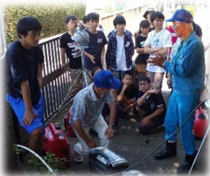
地域の方に発電機の使い方を 教えていただく小・中学生