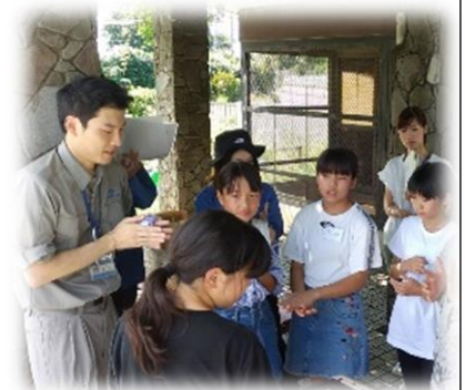
防災拠点でのペットの受け入れ について、区役所の方から教 えていただく小学生