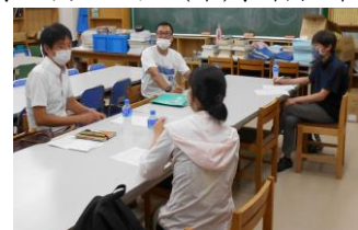
4校児童支援専任・生徒指導専任による話し合いの様子