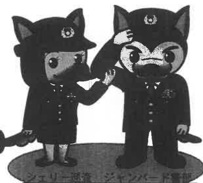
少年育成課マスコット