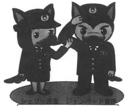
少年育成課マスコット