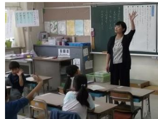
1年 国語の公開授業

令和2年度から国語科を共通教科として取り上げ、「豊かにかかわり合い、自分のよさに気付く子どもの育成を目指す」ことをテーマに、一人一回ずつ公開授業を行い、全教職員で見合いながら、よりよい授業の在り方を研究しています。年間5回ある授業研究会では、毎回外部から講師を招請しご指導いただいています。