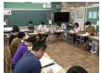
情報研の校内指導案検討会

この他にも、経験の浅い教員たちで組織するメンター研や教育実習における示範授業を教員同士が見合うなど、本校では、授業力向上に向けた研究・研修に特に力を入れています。