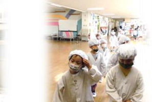
6月 第5週の時間割 (☆は、下校時刻です)