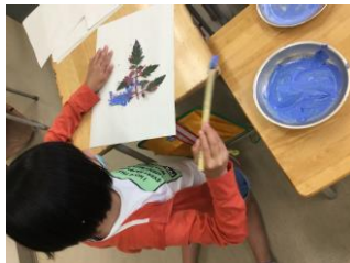
トマトの葉の模様

自分たちで育てている野菜の葉を使って、染物をしました。野菜の葉に布用のアクリル絵の具をつけ、布の上に置いて手で叩き、葉っぱの模様を付けました。葉の置き方にも個性が出て、それぞれに素敵な染物になりました。ランチョンマットとして、使えます。家に持ち帰りますので、楽しみにしてください。