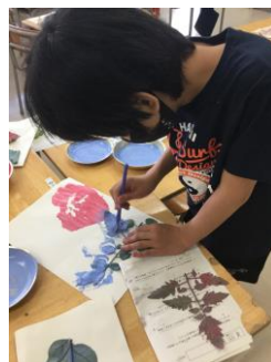
キュウリの葉の模