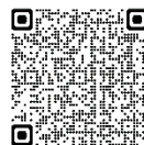
※第4期横浜市教育振興基本計画