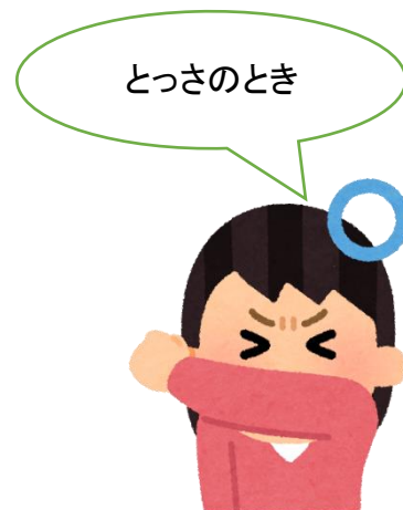
③ 袖で口と鼻を覆う