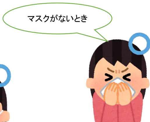
② ハンカチやティッシュで 口と鼻を覆う