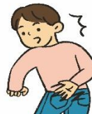
きがえをかりたい