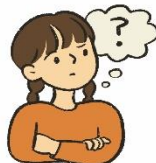
心や体を知りたい