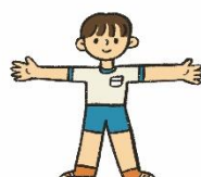
体のようすを知りたい