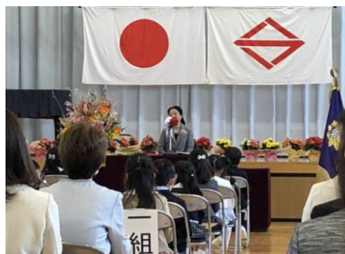
<入学式 當間会長挨拶>