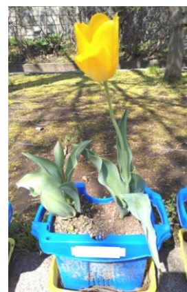
<1年生を迎えるため、2年生が育てたチューリップ>

4月 7日(火) 新登校班顔合わせ 4月 17日(金) 第1回常任委員会 4月 17日(金) 地区別登校班指導集会 4月 23日(木) スクールゾーン安全対策協議会説明会 4月 学援隊紹介集会・茶話会 5月 旗振り講習会