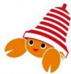
ベルマークキャラクター 「ベルマーくん」