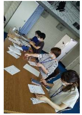
ベルマーク集計中 🟡