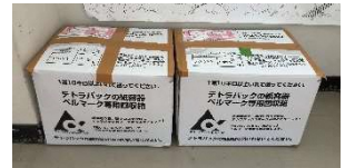
発送したテトラパック