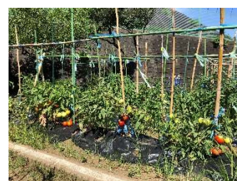
花壇の夏野菜も 元気に育っています