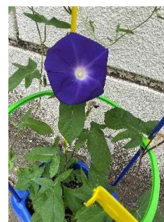
学校の朝顔が 色鮮やかに咲いています

6月28日(火) 横浜市PTA連絡協議会 常任委員会 全体会 広報委員会 第1回定例会