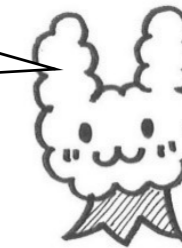
学校キャラクター くすのきうビット

昨年度の卒業生が在校生に向けて、メッセージを残してくれました。この思いを受け継いで30周年を盛り上げていきましょう！