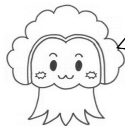
学校キャラクター サルスベッホー

昨年度の卒業生が在校生に向けて、メッセージを残してくれました。この思いを受け継いで30周年を盛り上げていきましょう！