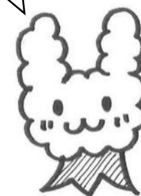
学校キャラクター くすのきうビット

学年目標の発表と、児童運営委員会の盛り上げ方は、素晴らしく、全校で歌う校歌は体育館に響き渡りました。