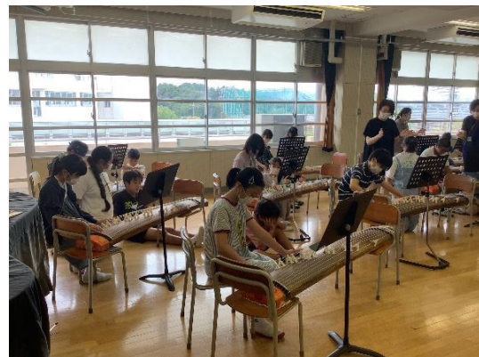
6年 音楽 琴教室