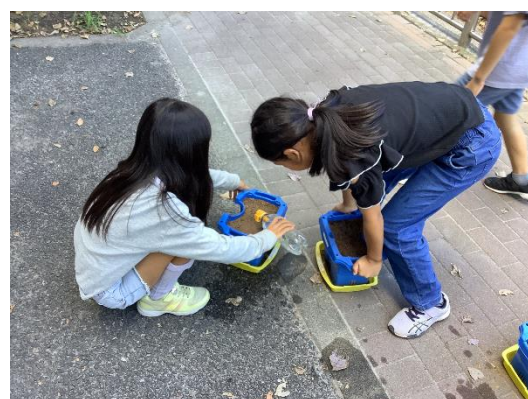
2年 生活 くんぐんそだて おいしいやさい