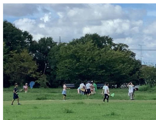
3年 理科 虫のかんさつ