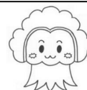
学校キャラクター サルスペッカー

運動委員会企画の30周年記念学校オリンピックが開催されました。校庭ではドッジボール、体育館ではフリースローが行われ、参加した児童はとて楽しそうに取り組んでいました。