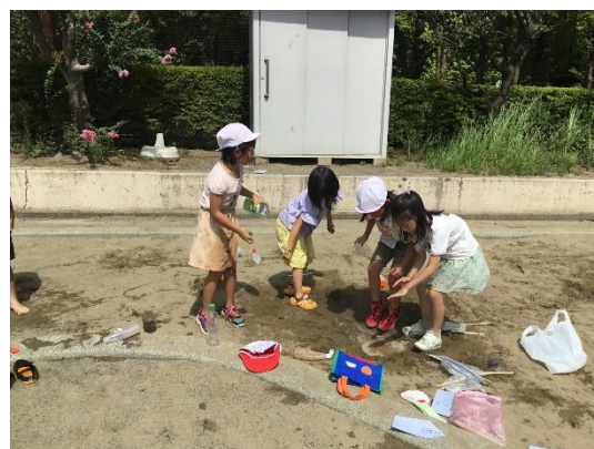
1年 生活 なつだ とびだそう