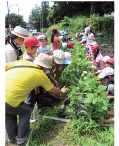
大豆に付いた虫とり

子ども達だけではなかなか大変な草取り作業……。地域の方のお力をお借りして、夏の暑い日に行いました。そのおかげで、無事大豆の収穫ができ、子ども達は貴重な体験をすることができました。