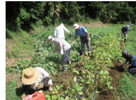
草取り作業の様子

子ども達だけではなかなか大変な草取り作業……。地域の方のお力をお借りして、夏の暑い日に行いました。そのおかげで、無事大豆の収穫ができ、子ども達は貴重な体験をすることができました。