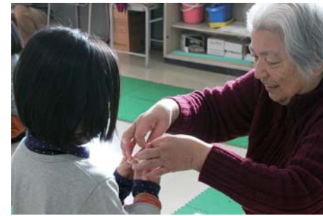
あやとりも丁寧に教えていただきました。