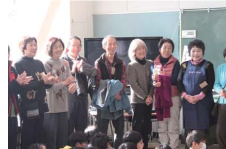
子ども達の感想を聞いて地域の皆さんのこの笑顔！

「こま」「けん玉」「メンコ」「あやとり」「おはじき」「お手玉」「だるま落とし」「羽根つき」など、昔の遊びができました。