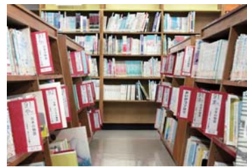
きれいに整理された本棚

環境整備のボランティア「花壇ボランティア」、「ブックハーモニー」は随時募集中です。ご興味のある方は学校までお問い合わせください。