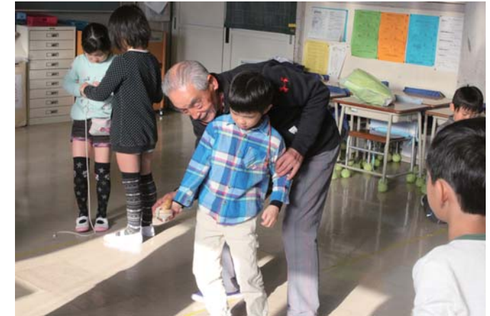
こま。構えが大事だね！うまく回ったかな？

1年生の授業で取り上げられる「昔遊び」では、以前より地域の方々に体験のお手伝いをご協力頂いていますが、昨年度よりフレンドくんの会も一緒にお手伝いさせて頂いています。