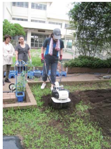
耕運機も使いこなします！

嶮山小には、花壇がたくさんあります。子ども達が管理している花壇以外を、主に保護者の方々からなる「花壇ボランティア」の皆さんにお願いして、きれいに整備して頂いています。