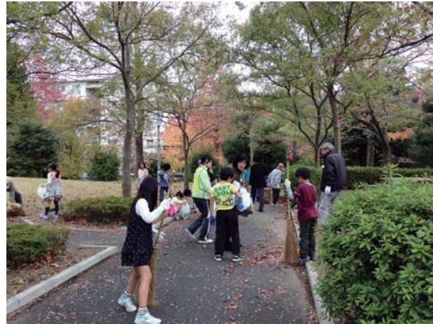
この日は落ち葉がいっぱい！

普段から地域の方々がきれいに掃除されているおかげでゴミはほとんどありません。そんな地域の方々の活動に支えられて公園が使えるのだ、ということがわかった地域清掃活動となりました。