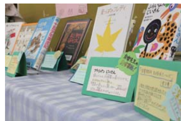
図書室には工夫がいっぱい！わかりやすく本の紹介がされています。