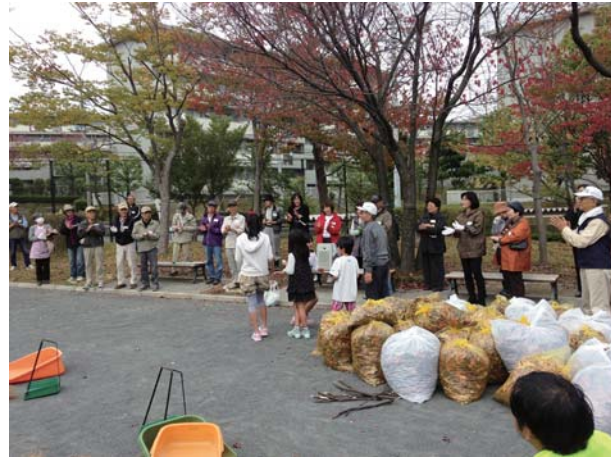
地域の皆さん、いつもありがとう。