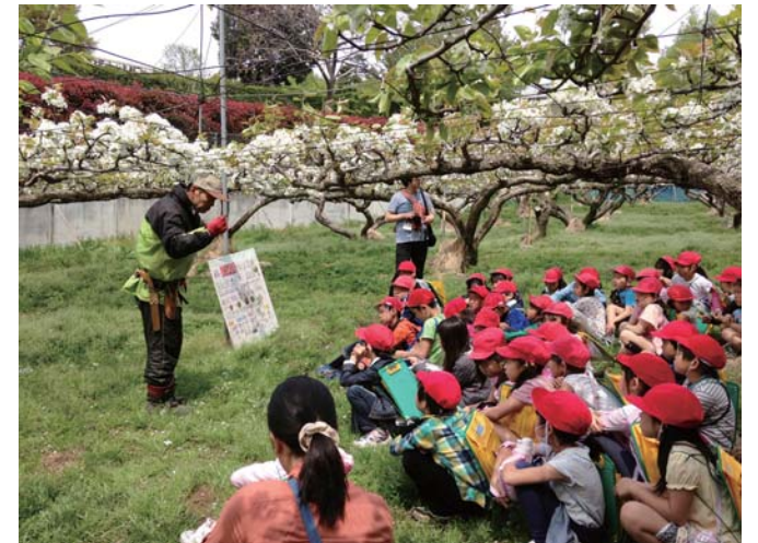
3年生 浜なしの観察

学校からのサポート依頼を受け、その内容に合った 協力者に依頼、打ち合わせ、調整などを行い、実際 の活動につなげていきます。