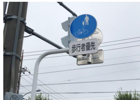
【もみの木台交差点の標識修繕】