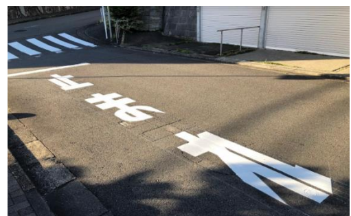
【リビオ裏道路路面表示修繕】