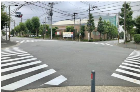
【大黒橋西側路面標示修繕】