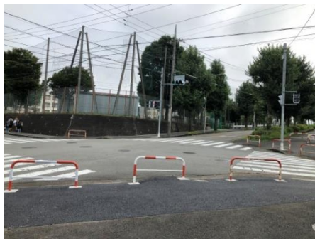
【すすき野中学校前交差点歩道補修】

スクールゾーン対策協議会で要望を出したいいくつかの点について、早くも対応していただきました！協議会を開催することで、皆様からいただいた声を届けることができました。