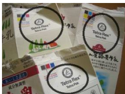
牛乳・ジュースの1リットル 紙パックの例

パックを切り開いた状態で 学校の児童昇降口(1年1組靴箱向かいの壁側)設置の回収箱へ入れて下さい。