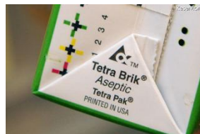
豆乳やストロー付きジュース 紙パックの例(底面)