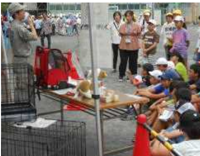
ペットを飼っている人は…

9月1日(土)、地域防災訓練が行われました。今年度も、土曜授業日に児童の避難訓練を行った後、5年生の児童が地域防災訓練に参加させていただき形をとりました。5年生は、参集してきた方たちと一緒に、給水訓練、炊き出し訓練、簡易トイレ