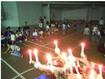
キャンドルファイヤーで盛り上がる

野外炊事ではご飯を炊いてカレー作り。おいしくいただいた後はキャンドルファイヤーでまた大盛り上がり。その後お風呂で汗を流してから床につきました。2日目は、朝からみさき魚市場へ。ずらりとまぐろが並ぶ光景は壮観でした。村へ帰ってきてからはウォークラリー。砂浜、磯、町歩きを楽しみました。あいにくの空模様でしたが、予定していた全てのプログラムを実施することができました。