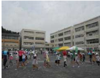
子どもたちが避難、大人も参集

トイレ便座とトイレパックの取り扱い説明、災害時のペットの取り扱い、水消火器の取り扱いの5カ所を、クラスでまとまって順番にまわりました。