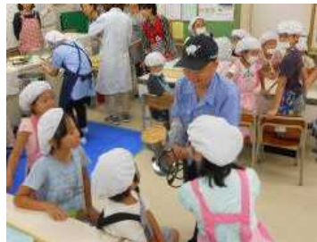
大豆があつという間にきな粉に

9月18日(火)～20日(木)の3日間にわたって、豆腐屋さんをお招きして豆腐づくり体験を行いました。豆乳とにがり混ぜて豆腐をつくっていきます。「にがり混ぜるとどろどろになったよ」と話す子どもたち。「大豆からきな粉になるなんて初めて知った!」「海水からにがりができるんだ」と驚いている子もいました。そして、自分たちがつくった豆腐を食べて、「ほっぺたが落ちるほどおいしかった!」。とてもいい体験になりました。