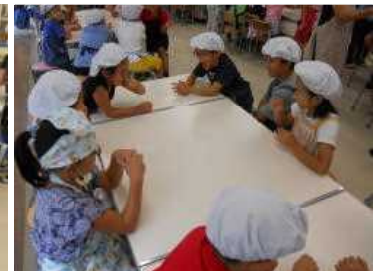
にがりをなめてみたら…