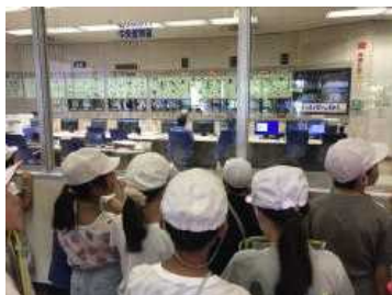
中央管制室を見学

自分たちが出したごみがどうなるのか、分別された資源はどのように生まれ変わるのか、見学を通して学ぶことができました。「4年生みんながすっぽり入ってしまうほどのクレーンの大きさに驚いた」「1時間もかけてごみを焼いていることを初めて知った」と、新たな発見をした子どもたち。大切なのは、学んだことを自分たちの生活にかかしていくことです。その大きなきっかけとなった見学でした。