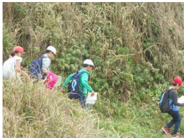
はぐれないで歩こう

以下は子どもたちの感想です。「初めて切られていないマグロを見て、こんなに太いんだと思った」「野菜を切るのに失敗したけれど、みんなが大丈夫と言ってくれて元気が出た」「ご飯やニンジンが固かったけれどおいしかった」「キャンドルファイヤーは、今までで一番盛り上がっていたのでうれしかった」「時計係の友達が、今何時だからそろそろ行くよとか、持ち物係の友達が、ちゃんと持った?とか声をかけてくれたので、協力できたと思った」。『みんなですべて力を合わせて前進し、きずなを深めよう』のスローガンが達成できた2日間でした。