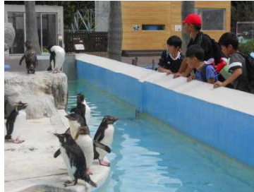
ペンギンのかわいい動きに釘付け

1日目は行きのバスから歌やゲームでまずひと盛り上がり。そして油壺マリリンパークでイルカショーなどを楽しみ、お弁当を食べた後は近くの海辺で磯の観察。子どもたちはカニやヤドカリ、小さい魚などを見つけて大喜び。そしてまたバスに乗り三浦ふれあいの村(YMCA グローバル・エコ・ヴィレッジ)へ。