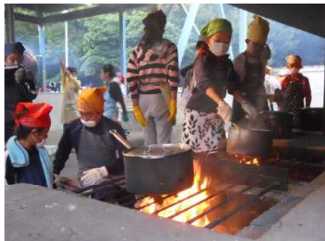
おいしくできるかな