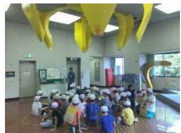
うわっ! クレーンが!!

自分たちが出したごみがどうなるのか、分別された資源はどのように生まれ変わるのか、見学を通して学ぶことができました。「4年生みんながすっぽり入ってしまうほどのクレーンの大きさに驚いた」「1時間もかけてごみを焼いていることを初めて知った」と、新たな発見をした子どもたち。大切なのは、学んだことを自分たちの生活にかかしていくことです。その大きなきっかけとなった見学でした。