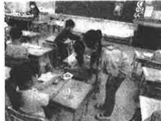
6年生が1年生のサポート中